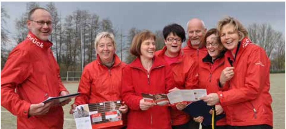
Gut lachen hat das Sportabzeichenteam für die vielen abgenommenen Prüfungen in 2015.