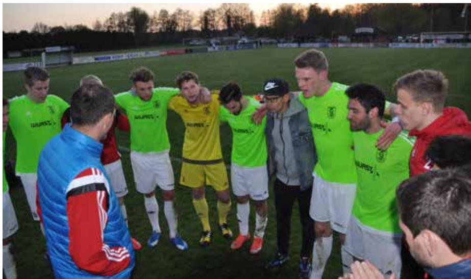
Wie im Spiel gegen BW Lohne gab es auch nach dem Spiel gegen Wilhelmshaven einen Grund zum Jubeln.